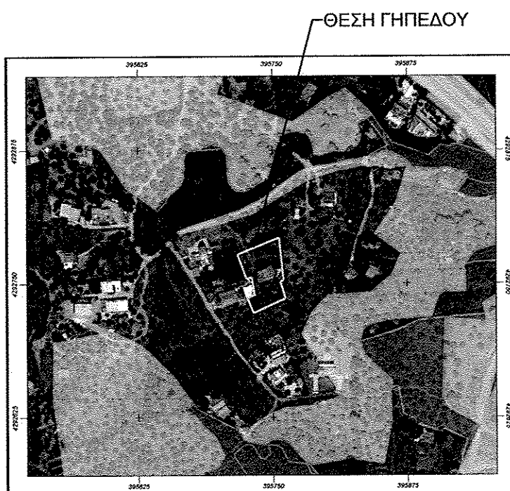
ΑΠΟΣΠΑΣΜΑ ΔΑΣΙΚΟΥ ΧΑΡΤΗ ΜΕΡΙΚΩΣ ΚΥΡΩΜΕΝΟ (ΚΛΙΜΑΚΑ : 1:5000)

ΕΜΒΑΔΟΝ ΓΕΩΤΕΜΑΧΙΟΥ ΒΑΣΕΙ ΠΡΑΞΗΣ ΧΑΡΑΚΤΗΡΙΣΜΟΥ ΑΡ. 1566/2001 του Δασαρχείου Αταλάντης, Ε(Α,Β,Γ,Δ,Α 1 )= 1174,31τμ ΕΜΒΑΔΟΝ ΓΕΩΤΕΜΑΧΙΟΥ Ε(ΑΒΓΔΕΖΗΘΙΚΛΜΝ-Α)= 2002,85μ 2 (προσαρμοσμένο περιγράμμα οικοδομικής άδειας & αποτύπωση σημερινής κατάστασης) ΠΑΡΑΤΗΡΗΣΕΙΣ: 1. Το διάγραμμα είναι ενταγμένο στο κρατικό σύστημα συντεταγμένων ΕΓΣΑ '87 2. Οι διαστάσεις και τα εμβαδά υπολογίσθηκαν αναλυτικά από τις συν/νες των κορυφών 3. Η εξάρτηση από το ΕΓΣΑ '87 πραγματοποιήθηκε με σύστημα GPS και κώνοντα χρήση του Ελληνικού Συστήματος Εντοπισμού - HEPOS