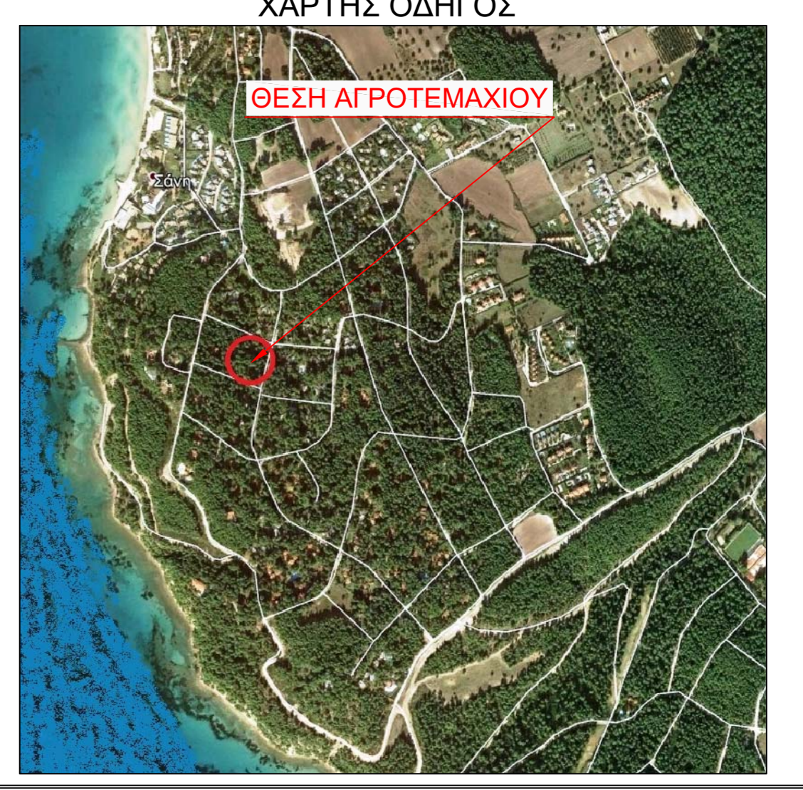
ΑΠΟΣΠΑΣΜΑ ΓΕΝΙΚΟΥ ΠΟΛΕΟΔΟΜΙΚΟΥ ΣΧΕΔΙΟΥ ΚΑΣΣΑΝΔΡΑΣ ΦΕΚ 180τ.ΑΑΠ/2014

ΜΕΘΟΔΟΣ ΕΞΑΡΤΗΣΗΣ: Το διαγράμμα είναι ενταγμένο στο κρατικό σύστημα συντεταγμένων Ε.Γ.Σ.Α.'87 Η εξάρτηση σε αυτό (Ε.Γ.Σ.Α.'87) πραγματοποιήθηκε με δέκτη GPS και με την χρήση του Ελληνικού Συστήματος Εντοπισμού - ΗΕΡΟΣ ΣΥΣΤΗΜΑ ΑΝΑΦΟΡΑΣ: ΕΛΛΗΝΙΚΟ ΓΕΩΔΑΙΤΙΚΟ ΣΥΣΤΗΜΑ ΑΝΑΦΟΡΑΣ 1987 (Ε.Γ.Σ.Α.1987) ΕΛΛΗΝΟΕΥΡΩΠΕΙΑ ΑΝΑΦΟΡΑ GRS 80 (a=6.378.137 b=6.356.752 f=1298.257222101) ΠΡΩΒΟΛΗ ΕΓΚΑΡΣΙΑ ΜΕΡΚΑΤΟΡΙΚΗ ΚΕΝΤΡΙΚΟΣ ΜΕΣΟΜΕΡΗΣΟΣ λ=24°00'00" ΜΕ ΣΥΝΤΕΛΕΣΤΗ ΚΑΙΜΑΚΑΣ κ=0,999900 ΠΡΟΣΘΕΤΙΚΗ ΣΤΑΘΕΡΑ ΣΤΟ Χ: Χ=500.000,00 m ΠΡΟΣΘΕΤΙΚΗ ΣΤΑΘΕΡΑ ΣΤΟ Υ: Υ=000,00 m ΓΕΩΓΡΑΦΙΚΟ ΠΛΑΤΟΣ ΑΝΑΦΟΡΑΣ φ=00°00'00"