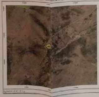
ΑΠΟΤΥΠΩΜΑ ΑΠΟ ΚΥΤΙΣΜΟΥ ΒΑΣΙΚΟΥ ΧΑΡΤΗ