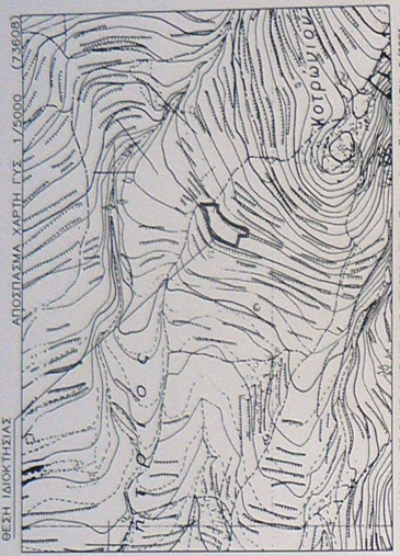
ΚΟΡΥΦΗ : ΣΤΑΣΙΟΣ ΟΙΚΙΣΜΟΣ ΜΕ ΚΕΝΤΡΟ ΤΗΝ 'Κατα Ραφά' ΑΠΟΒΛΗΤΗ : 6/2001

ΘΕΩΡΗΘΗΚΕ και εγκρίθηκε από αρμόδιο υπάλληλο της οικίας κτηνιατρικής υπηρεσίας με αριθμό 19-03-2024 ΑΝΤΙΣΤΡΑΤΗΓΗΣ ΔΙΕΥΘΥΝΤΗΣ ΚΤΗΝΙΑΤΡΙΚΗΣ ΥΠΗΡΕΣΙΑΣ ΚΑΡΔΙΑΣ Καταγραφή 06-03-2024 Η Συντάκτης Στριμπακό Αννα Ισοσταθμίστρια