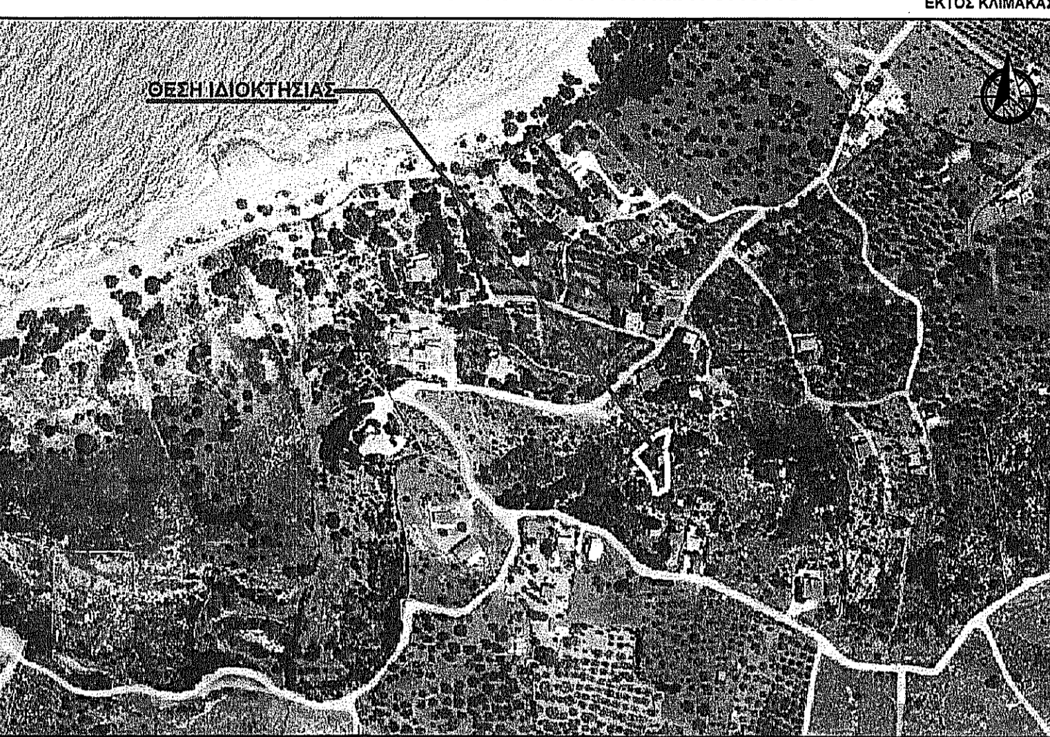
ΑΠΟΣΠΑΣΜΑ ΟΡΘΟΦΩΤΟΧΑΡΤΗ ΚΤΗΜΑΤΟΛΟΓΙΟΥ ΕΚΤΟΣ ΚΛΙΜΑΚΑΣ