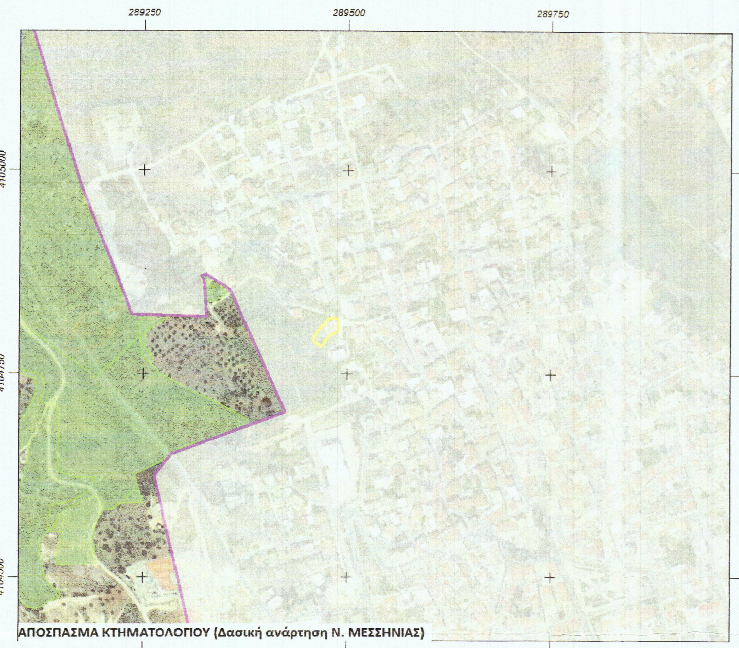
ΑΠΟΣΠΑΣΜΑ ΚΤΗΜΑΤΟΛΟΓΙΟΥ (Δασική ανάρτηση Ν. ΜΕΣΣΗΝΙΑΣ)

ΔΗΛΩΣΗ ΥΛΟΠΟΙΗΣΗΣ ΟΡΙΩΝ Ο κάτωθι υπογράφων, Χρήστος Γεωργιάκης, συνδιοκτήτης της ιδιοκτησίας (Α-Β-Γ-...-Π-Ρ-Α), εμβαδού Ε= 572,56 μ 2 , δηλώνω ότι τα όρια που έχω υλοποιήσει, είναι σωστά.