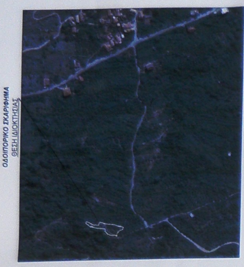
ΑΕΡΟΦΩΤΟΓΡΑΦΙΑ ΘΕΣΗ ΔΙΟΚΤΗΣΙΑΣ