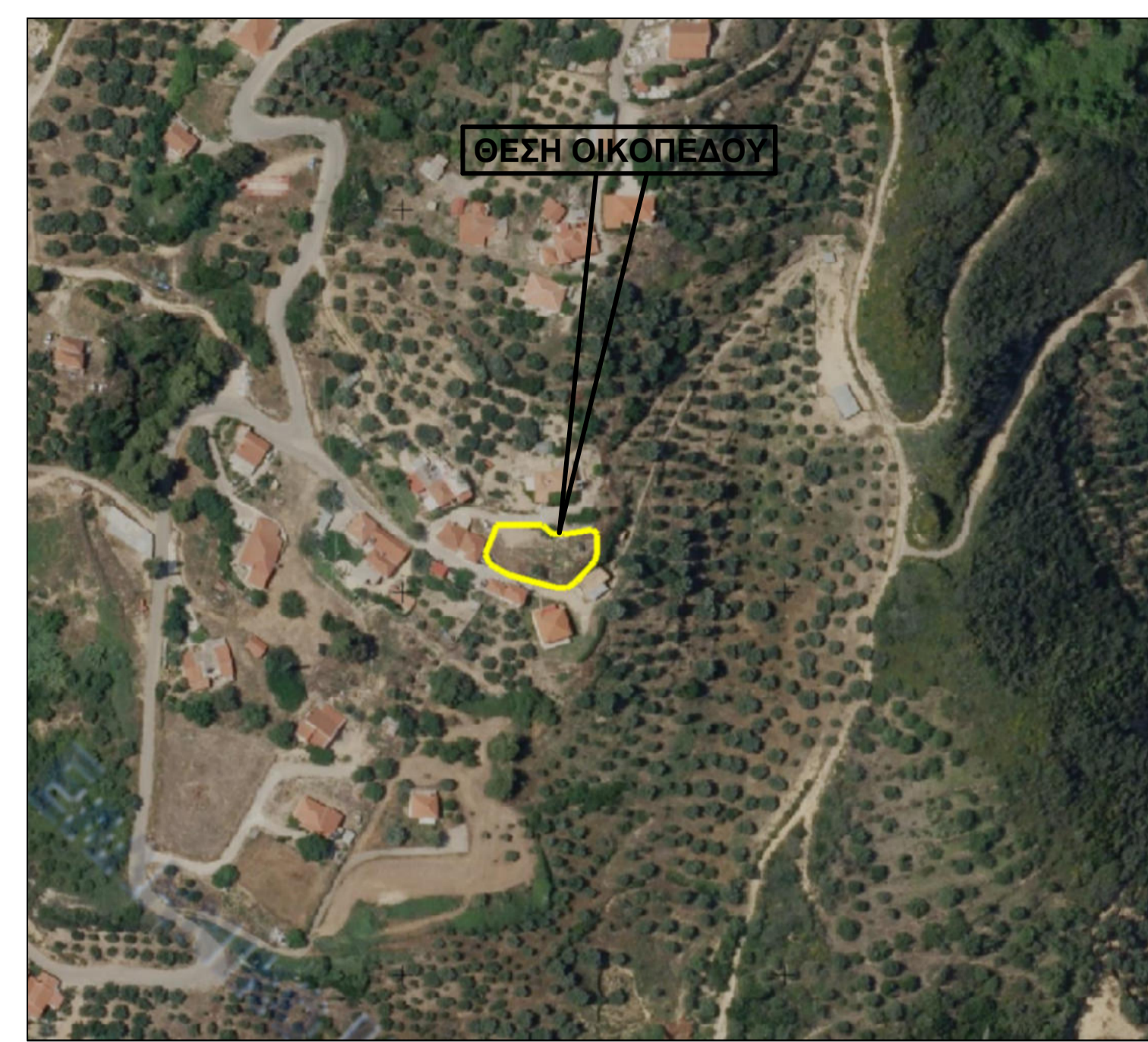
Απόσπασμα αεροφωτογραφίας κτηματολογίου