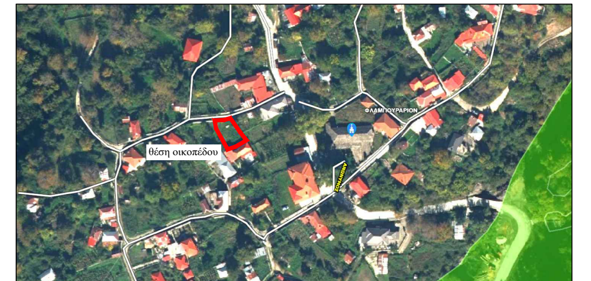
απόσπασμα οριστικού κυρωμένου Δασικού Χάρτη για την Π.Ε.Ιωαννίνων (υπ' αριθμ. 131933 απόφ. ΓΓΔ/ΥΠΕΝ ΦΕΚ 866 Α' 24.11.22 και υπ' αριθμ. 134341 απόφ. ΓΓΔ/ΥΠΕΝ ΦΕΚ 867 Α' 24.11.22)